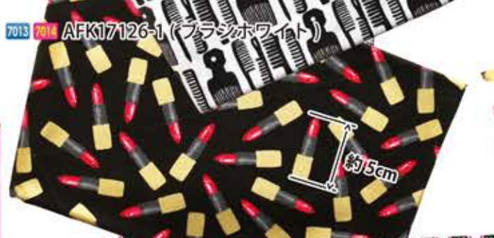
7017 7018 AFK17121-2 (リップブラック)