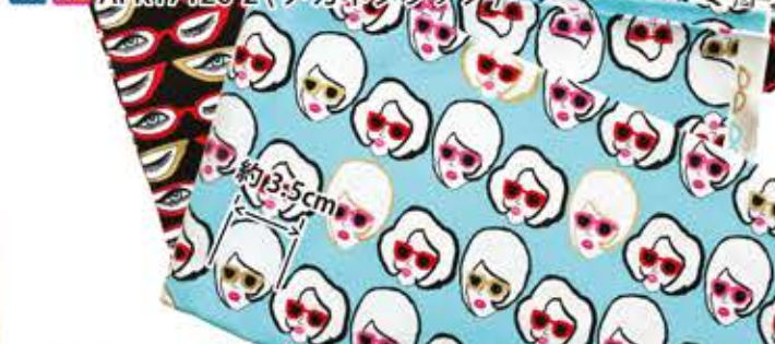
7005 7006 AFK17122-4 (フェイスブルー)