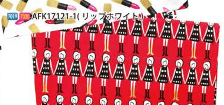
7023 7024 AFK17123-3 (ガールレッド)