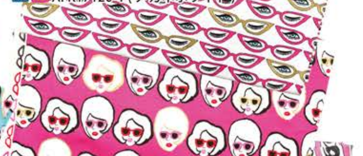
7007 7008 AFK17122-108 (フェイスピンク)