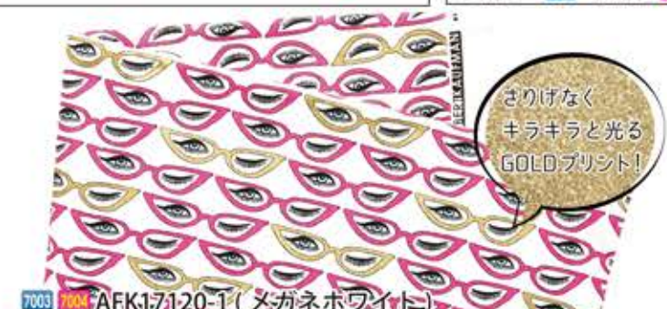
7003 7004 AFK17120-1 (メガネホワイト)