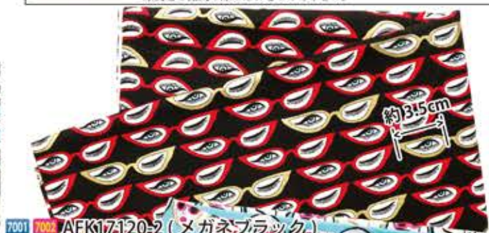
7001 7002 AFK17120-2 (メガネブラック)

セール番号の見方 商品・m単位の セール番号 0000 原反の セール番号 0000