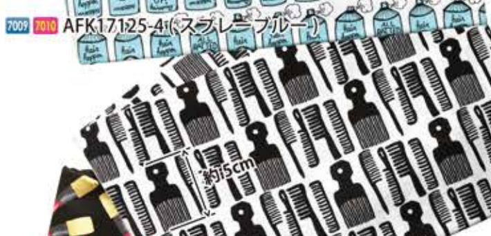
7013 7014 AFK17126-1 (ブラシホワイト)