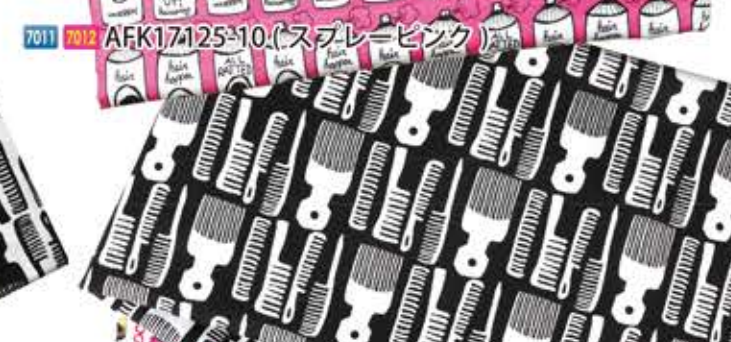
7015 7016 AFK17126-2 (ブラシブラック)