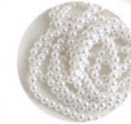
1150 PA-MAR3-200 ホワイト ■約395粒入