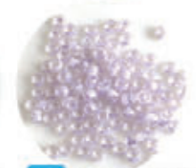
1147 MLB-1066-BA パステルパープル