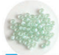
1146 MLB-1065-BA パステルグリーン