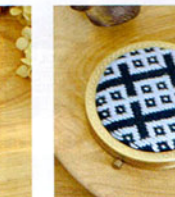
こぎん 23 (紺) コンパクトミラー ① JAN 187238 ¥1,500 (本体価格) ●オリーブ(CRNo.1100柄(コンプレス)) ●外径:約7cm 作品部分:約5.7cm ●コンパクトミラー付 ●出荷単位:1組