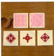
こぎん 12 (ベージュ) コースター ① JAN 187120 ¥1,500 (本体価格) (5枚1組) ●オリーブ(CRNo.1100柄(コンプレス)) ●約縦10cm×横10cm ●出荷単位:1組