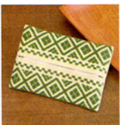
こぎん 10 (ベージュ) ティッシュケース ① JAN 187106 ¥1,000 (本体価格) ●オリーブ(CRNo.1100柄(コンプレス)) ●約縦9cm×横13cm ●出荷単位:1組