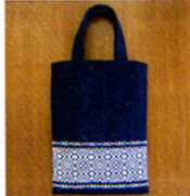
こぎん 17 (紺) バッグ ① JAN 187250 ¥2,600 (本体価格) ●オリーブ(CRNo.1100柄(コンプレス)) ●約縦34cm×横25cm(持ち手除く) ●裏側付 ●出荷単位:1組