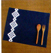
こぎん 15 (紺) ランチンマット ① JAN 187151 ¥1,500 (本体価格) ●オリーブ(CRNo.1100柄(コンプレス)) ●約縦30cm×横40cm ●出荷単位:1組