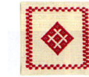
こぎん 18 (ベージュ) コースター ① JAN 187182 ¥500 (本体価格) ●オリーブ(CRNo.1100柄(コンプレス)) ●約縦10cm× 横10cm×横10cm ●出荷単位:1組

はじめての方でも、お手軽に楽しめるキットです。繊細で美しい幾何学模様のコースターが1枚作れます。(伝統模様の図案集付)