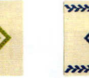
こぎん 20 (ベージュ) コースター ① JAN 187205 ¥500 (本体価格) ●オリーブ(CRNo.1100柄(コンプレス)) ●約縦10cm× 横10cm×横10cm ●出荷単位:1組