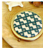
こぎん 22 (ベージュ) コンパクトミラー ① JAN 187289 ¥1,500 (本体価格) ●オリーブ(CRNo.1100柄(コンプレス)) ●外径:約7cm 作品部分:約5.7cm ●コンパクトミラー付 ●出荷単位:1組