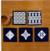
こぎん 13 (紺) コースター ① JAN 187137 ¥1,500 (本体価格) (5枚1組) ●オリーブ(CRNo.1100柄(コンプレス)) ●約縦10cm×横10cm ●出荷単位:1組