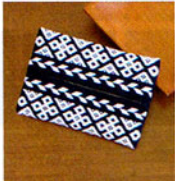
こぎん 11 (紺) ティッシュケース ① JAN 187113 ¥1,000 (本体価格) ●オリーブ(CRNo.1100柄(コンプレス)) ●約縦9cm×横13cm ●出荷単位:1組