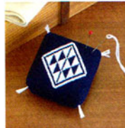
こぎん 9 (紺) ピンクッション ① JAN 187090 ¥900 (本体価格) ●オリーブ(CRNo.1100柄(コンプレス)) ●約縦5cm×横5cm×高さ3cm ●紐付 ●出荷単位:1組