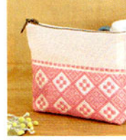
こぎん 26 (ベージュ) ポーチ ① JAN 187287 ¥1,500 (本体価格) ●オリーブ(CRNo.1100柄(コンプレス)) ●約縦10cm× 横14.5cm×マチ3cm ●出荷単位:1組