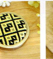
こぎん 25 (ワイン) コンパクトミラー ① JAN 187250 ¥1,500 (本体価格) ●オリーブ(CRNo.1100柄(コンプレス)) ●外径:約7cm 作品部分:約5.7cm ●コンパクトミラー付 ●出荷単位:1組