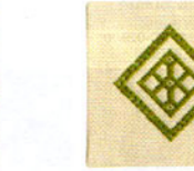
こぎん 19 (ベージュ) コースター ① JAN 187189 ¥500 (本体価格) ●オリーブ(CRNo.1100柄(コンプレス)) ●約縦10cm× 横10cm×横10cm ●出荷単位:1組