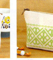
こぎん 27 (ベージュ) ポーチ ① JAN 187274 ¥1,500 (本体価格) ●オリーブ(CRNo.1100柄(コンプレス)) ●約縦10cm× 横14.5cm×マチ3cm ●出荷単位:1組