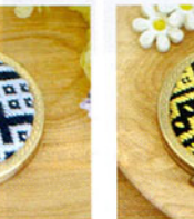
こぎん 24 (紺) コンパクトミラー ① JAN 187243 ¥1,500 (本体価格) ●オリーブ(CRNo.1100柄(コンプレス)) ●外径:約7cm 作品部分:約5.7cm ●コンパクトミラー付 ●出荷単位:1組