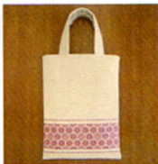
こぎん 16 (ベージュ) バッグ ① JAN 187168 ¥2,600 (本体価格) ●オリーブ(CRNo.1100柄(コンプレス)) ●約縦34cm×横25cm(持ち手除く) ●裏側付 ●出荷単位:1組