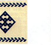
こぎん 21 (ベージュ) コースター ① JAN 187212 ¥500 (本体価格) ●オリーブ(CRNo.1100柄(コンプレス)) ●約縦10cm× 横10cm×横10cm ●出荷単位:1組