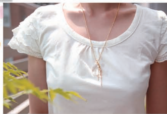
Rec155 しずく型ネックレス