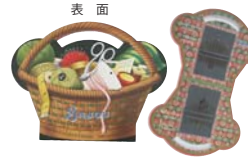
POC-6(loctudy) サイズ：横約14.5cm 縦約11.5cm