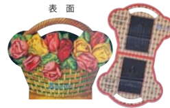
POC-5(pontivy) サイズ：横約14.5cm 縦約11.5cm