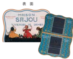
POC-1(crozon) サイズ：横約14cm 縦約9.8cm